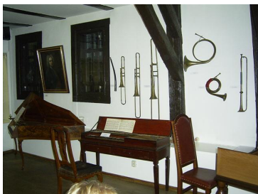
(Originele barokinstrumenten; Bachhaus/ Eisenach – oude museum in gebouw ; en Bachhaussaal)

We blijven drie nachten in het 3-sterren Ibis Hotel dat vlak buiten de stad Eisenach ligt. We eten in de stad aan het mooie marktplein (buffet of à la carte – eigen rekening ) en bezoeken dan het Bachhaus en museum waar we een exclusief historisch avondmuziek concert krijgen. De volgende dag kunt U zelf nog een muzikale demonstratie (met 300 originele barok-instrumenten en voordracht) in dit museum krijgen van ca. 1½ uur. Terug in het hotel tijd om wat na te praten onder het genot van een drankje met korte PowerPoint om alvast vóór te genieten van de dag van morgen.