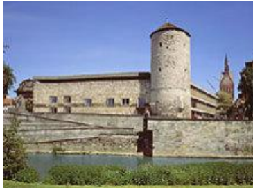
(Historisch museum Hannover)