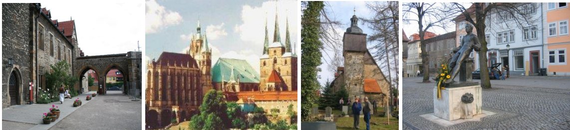
(Augustijnerklooster, Dom/Stefanuskerk - Erfurt) (Kerk Dornheim) (Bach standbeeld – Arnstadt)

Dag 4 – zaterdag 28 augustus – ontbijt vanaf 07:30 uur in het restaurant. Om 08:30 uur nemen we afscheid van Eisenach en rijden via Ohrdruf (waar J.S. Bach 5 jaar woonde). Daar genieten we van een kop koffie na een kleine wandeling om de Bachplaatsen te zien. Vervolgens naar Arnstadt zelf. De grote componist begon hier zijn carrière en bracht er vier jaar door. Ook hier een Bachwandeling die om 12:30 uur eindigt in de J.S. Bachkerk waar een Bachorgel staat, dat het dichtst komt bij de originele instrumenten waarop Bach zelf speelde. We rijden vervolgens door naar Weimar waar we de Herderkerk bezoeken. Vijf van J.S. Bachs en Maria Barbara's kinderen werden hier gedoopt. Tijd en weder dienende is er o.l.v. Uw eigen reisleader een korte wandeling door Weimar. We eten ons diner ( eigen rekening ). in deze wereld-beroemde stad van Goethe, Schiller, Nietzsche en nazi's. We hebben gelukkig hier meer tijd dan eerder was aangegeven. Om 18:00 uur rijden we door naar Halle vanwege het Leipzig-programma van morgen. We blijven 4 nachten in het strategisch gelegen 4-sterren hotel Alba Mercure in Halle-Peißen vlakbij de Autobahn (geen tijdverlies door files - zie p. 4).