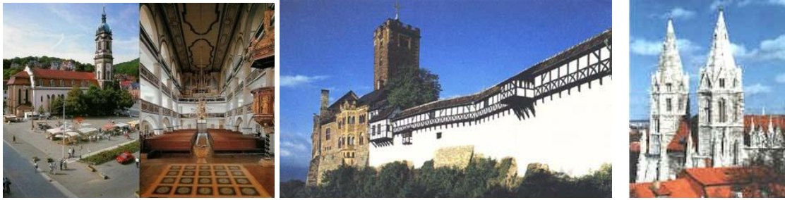
(Markt & Interieur St. Joriskerk; Wartburg in al zijn pracht) (Mühlhausen - Divi-Blasii kerk)

Tel. (31) 0595-422.738/ 426.065 (antw. app.) Fax +31-84-835.3750 (mob.) 06-1203.5677