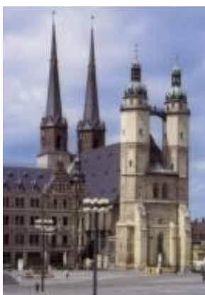
(Marienkirche & Marktplatz