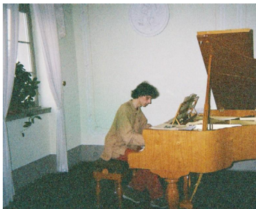
(Heinrich Schützhaus – Weißenfels)

Scheidt was een belangrijk componist tijdens de 30-jarige oorlog (vele melodieën vindt U terug in zangbundels o.a. Gezang 316 in Liedboek voor de Kerken). Vervolgens vertreden we ons wat in het centrum (Rote Turm) of drinken koffie drinken op het terras. Om 11:30 uur stappen we op de bus naar Weißenfels waar Heinrich Schütz (1585-1672) opgroeide en zijn laatste levensjaren door bracht. Hij wordt wel de vader der Duitse muziek genoemd. Van interesse voor ons Bachstudenten is dat de 2 e vrouw van Bach hier vandaan kwam, en dat in Hotel Jägerhof (eerst vermeld in 1450) Bachs Jagdkantate voor het eerst werd uitgevoerd. Wij gaan hier een voortreffelijk middagmaal gebruiken (zie menu - eigen rekening ). Daarna bezoeken wij het tijdelijke onderkomen van het Heinrich Schützhaus (wegens restauratie gesloten), en het kasteel op de heuvel van de vorsten van Weißenfels-Halle, die uiteindelijk bepalend waren voor de muzikale carrières van vooral G.F. Händel. We zijn om 18:30 uur terug in het hotel in Halle-Peißen, waar een buffet U wacht (warm of koud naar keuze ( inclusief in reiskosten )). Avond vrij te besteden.