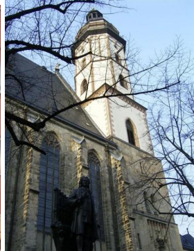
(Thomaskirche – Leipzig)