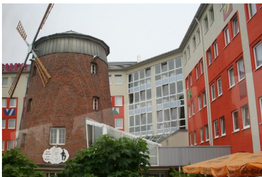
(Hotel in Halle-Peißen)

Na rondgang door de kerk zelf, drinken we koffie in het nabijgelegen Bachcafé - Pagina 3 (waar Bachkoffie etc. te koop is). Vervolgens een kort bezoek aan het ernaast gelegen, net opnieuw geopende Barcharchiv . We eten een broodje en hebben vervolgens een busrit rond Leipzig met onze Nederlandse gids (hier al 20 jaar resident). We bezoeken o.a. het gerechtshof waar Marinus van der Lubbe ter dood werd veroordeeld, en het nieuw-Gothische stadhuis; het begin 20 e eeuw afgebroken paleis was in 1519 de locatie waar Martin Luther en prof. Johannes Eck hun beroemde theologisch dispuut hadden. Verder bezoek aan het Völkerschlachtm Monument en de Russisch-orthodoxe kathedraal. We worden aan het einde van de middag weer afgezet aan de rand van het stadscentrum bij het Gewandhaus en de Opera – twee belangrijke bezoekoepies voor ons als muziek liefhebbers. Maar U kunt ook een bezoek brengen aan het Mendelssohnhaus (waarvoor de befaamde dirigent Kurt Masur het benodigde geld na de Wende bijeenpraatte). Ieder is vrij te gaan en te staan tot aan het begin van de avond. U kunt onze gids ook volgen in een stadswandeling te voet. Een extra attractie/ andere optie is een avondconcert in het Gewandhaus of de opera ( meerkosten ). We dineren ( eigen rekening ) in de stad Leipzig. En we zijn dus vrij laat terug in het hotel. Het wordt een erg lange dag!