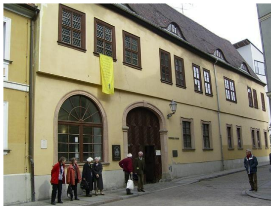
- Händelmuseum - Halle)