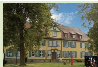
(Hotel buiten Eisenach)

We blijven drie nachten in het 3-sterren Ibis Hotel dat vlak buiten de stad Eisenach ligt. We eten in de stad aan het mooie marktplein (buffet of à la carte – eigen rekening ) en bezoeken dan het Bachhaus en museum waar we een exclusief historisch avondmuziek concert krijgen. De volgende dag kunt U zelf nog een muzikale demonstratie (met 300 originele barok-instrumenten en voordracht) in dit museum krijgen van ca. 1½ uur. Terug in het hotel tijd om wat na te praten onder het genot van een drankje met korte PowerPoint om alvast vóór te genieten van de dag van morgen.