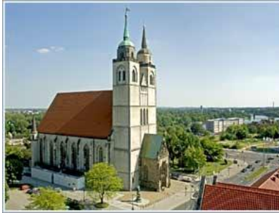
(Johanniskirche en Dom in Magdeburg.)