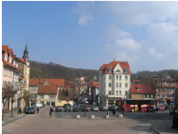
(Frauenplan bij het Bachmuseum in Eisenach)