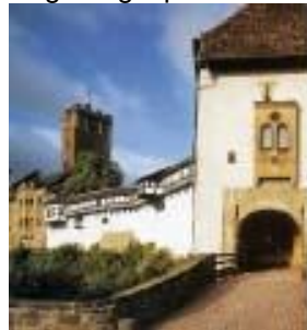
(Dom en Stefanuskerk - Erfurt) (Feestzaal en toegang tot de Wartburg boven Eisenach)

Dag 6 – Op dinsdag 02 november (na het buffet ontbijt) bezoeken we vanzelfsprekend de kerk waar J.S. Bach en zijn broers gedoopt werden (en o.a. Telemann later kantor en organist was): de Georgenkirche in Eisenach. Daarna rondleiding in de kerk en de kans om aardig wat van de geboortestad van J.S. Bach te zien. Luther ging hier naar dezelfde Latijnse school als J.S. Bach 200 jaar later, omdat zijn familie uit het nabijgelegen Möhra kwam. We wandelen langs deze school, naar het (waarschijnlijke) graf van J.S. Bachs ouders. Lunch op eigen gelegenheid. 's Middags bezoek aan de Wartburg , waar Luther in 1521 in 10 maanden het Nieuwe Testament en de Psalmen in het Duits vertaalde. Genoeg tijd om souvenirs te kopen. Voor liefhebbers: een bezoek eind van de middag aan de Lutherkerk in Möhra met een muzikaal optreden van de lokale dominee (hij is geboren op dezelfde dag als Martin Luther!). Een prachtige afsluiting van onze Lutherreis. Wie echter 's middags nog liever wat ronddoelt in Eisenach wordt om 18:30 uur opgehaald. We zijn in ons hotel om 19:30 uur voor ons slotdiner. Tijd om uitgebreid na te praten en samen wat te drinken.