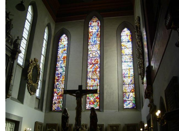
A. Wittenberg: stadhuis, markt en Stadtkirche; B. Slotkerk met markante toren; C. Erfurt - klooster

Dag 5 - Op maandag 01 november (Allerheiligen) vertrekken we vroeg na het ontbijt om 08:45 uur (met een korte stop bij de Thomaskerk in Leipzig met orgelconcert en een kop koffie) naar Erfurt om het Augustijnerklooster te bezoeken waar Luther zijn loopbaan als monnik begon. Vervolgens korte wandeling door Erfurt – de 'Stadt der Turme'. Het is in totaal bijna drie uur rijden naar ons Hotel 'zum Herrenhaus' even buiten Eisenach, waar we worden verwacht voor ons avondmaal ca. 19:30 uur. Dan rustig ontspannen na een lange, mooie dag en een goed gesprek over morgen.