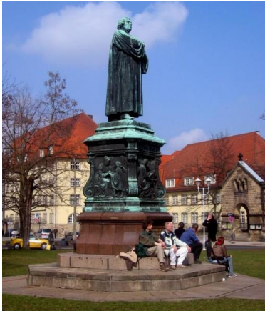
(Lutherbeeld in Eisenach)

Kosten – 6 nachten - 7 dagen (dus een dag en nacht langer dan in voorgaande jaren) - inclusief busreis, hotel en ontbijt, de meeste excursies inbegrepen , de rest hoofdelijk omgeslagen. Tot 31 mei (vroeg vogelkorting) : Echtparen en mensen die een dubbele kamer delen p.p. Euro 466 . Eenpersoonskamer p.p. Euro 526 . Als U 3-op-1 kamer wilt slapen – per offerte . Per 01 juni komt er een toeslag van Euro 20 p.p. Na 29 augustus worden de prijzen resp. Euro 566 en Euro 626 . Indien er nog plaats is na 29 september per offerte . Minimum aantal deelnemers is 22, maximum is 35.